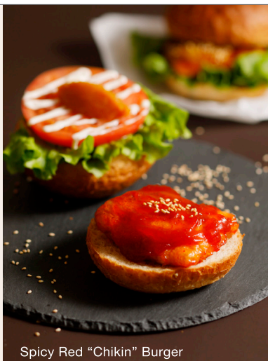
Spicy Red "Chikin" Burger