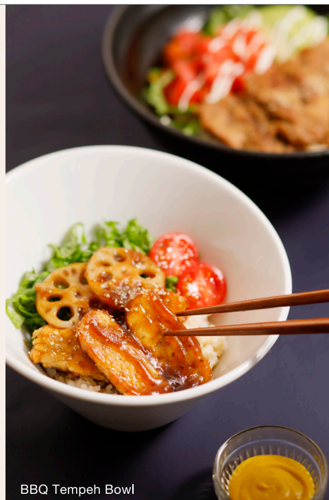
BBQ Tempeh Bowl